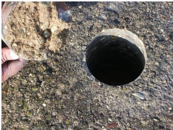
Рис. 12. Керн из монолитной бетонной плиты крепления грунтового откоса водохранилища. Состояние донной поверхности плиты – при бетонировании обратный фильтр вошёл в состав структуры плиты

Ультразвуковые методы, использующие для информации параметры эхо-сигналов от донной поверхности плит крепления, могут быть применены, если облицовки выполнены из сборных железобетонных плит, что встречается редко. В настоящее время ведется работа над методикой использования принципиально новых разработок фирмы АКС (г. Москва) – ультразвукового дефектоскопа А1220 Монолит и ультразвукового томографа А1040 М.