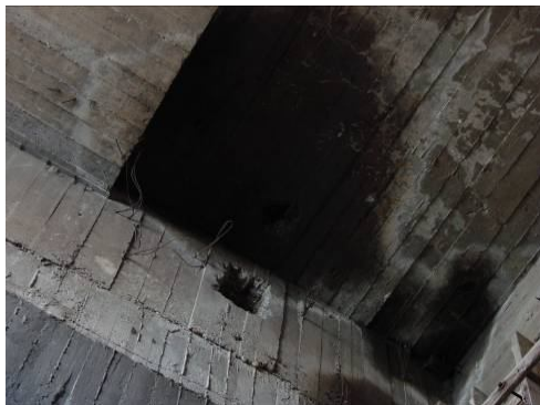
Рис. 5. Фильтрация масла через монолитный бетон массивного перекрытия (вид снизу)

Массивные монолитные конструкции гидротехнических сооружений имеют свои особенности. Сложности практического исполнения технологических приемов при бетонировании таких конструкций приводят к наличию многочисленных трещин раскрытием более нормативной величины 0,3 мм, а также швов как между блоками бетонирования, так и внутри массивных блоков из-за нарушения цикличности процессов укладки бетона.