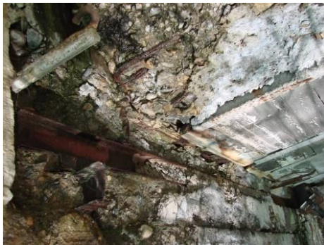
Рис. 2. Разрушения монолитного бетона в узле опоры балки на массивную стену из-за протечек по швам между блоками бетонирования