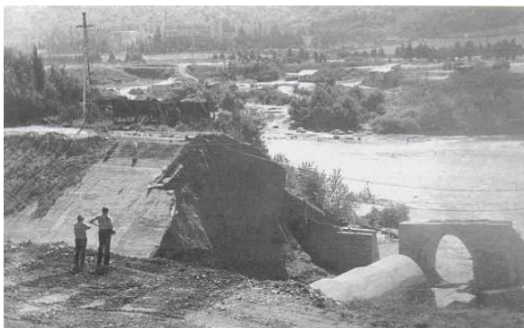
Рис. 10. Разрушение участка деривационного канала Земо-Авчальской ГЭС (Грузия)