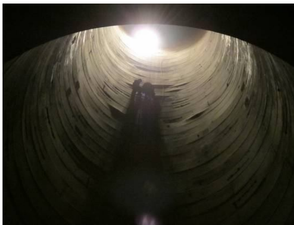
Рис.6. Оценка состояния металла в зоне вырывов металлической облицовки сталежелезобетонного турбинного водовода Саяно-Шушенской ГЭС

Примеры таких повреждений: вырывы участков облицовки камер рабочих колес (КРК), участков листов металла сопрягающих поясов КРК с опорным конусом, участков металлической облицовки закрытой части водосбросов на Саяно-Шушенской ГЭС (площадь вырыва до 2 \text{ м}^2 ). Выявлены крупноразмерные полости за металлической облицовкой сталежелезобетонных турбинных водоводов Саяно-Шушенской ГЭС, на внутренней стороне которой обнаружена активная коррозия (рис. 6-8). В частности, при ремонте в полости за облицовку участка водовода №3 было заинъектировано более 5 \text{ м}^3 ремонтного раствора.