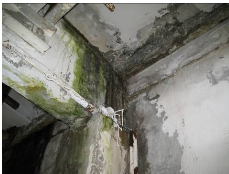
Рис. 3. Фильтрационное выщелачивание бетона в служебную галерею ГЭС в зоне дефектного шва между ярусами бетонирования