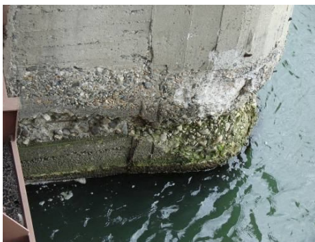
Рис. 4. Разрушение бетона бычка плотины в зоне переменного уровня воды с обнажением и коррозией арматуры