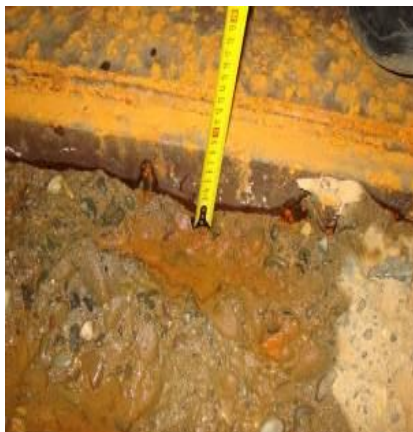
Рис. 8. Разрушение бетона под оторванным листом металлической облицовки секции участка закрытой части водосброса на глубину не менее 8 см

При контроле крупногабаритных конструкций, характерных для энергетических и гидротехнических сооружений, наиболее эффективна ультразвуковая дефектоскопия. Это связано с тем, что особенностью ультразвукового контроля массивных конструкций является практически стопроцентная возможность обеспечить при сквозном прозвучивании условия распространения упругих волн в бетоне, как в неограниченной трехмерной среде (наименьший размер тела d \geq \lambda , где \lambda – длина волны в плоскости, перпендикулярной направлению распространения волн). На трассах, проходящих через бездефектный бетон, на приемном тракте ультразвуковой аппаратуры формируется практически неискаженный сигнал. Соответственно, если на осциллограмме принятого сигнала проявляется искажение, то это следствие внутренних нарушений структуры материала или конструкции. В зависимости от вида дефекта искажения могут иметь различную форму, например: