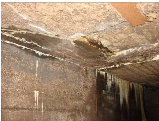
Рис. 1. Фильтрационное выщелачивание бетона в зоне дефектного шва между блоками бетонирования и через трещины в монолитном бетоне

В бетонных гидротехнических сооружениях должна производиться проверка прочности бетона на участках, подверженных воздействию динамических нагрузок, фильтрующейся воды, минеральных масел, регулярному промерзанию и расположенных в зонах переменного уровня.