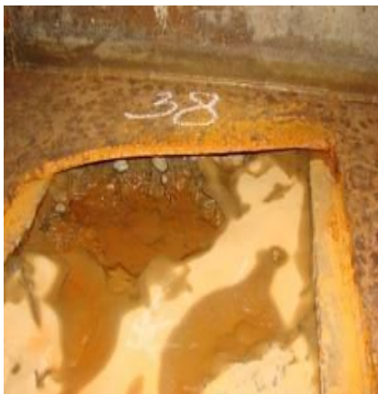
Рис. 7. Отрыв листа металлической облицовки лотковой части секции горизонтального участка закрытой части водосброса. Фрагмент