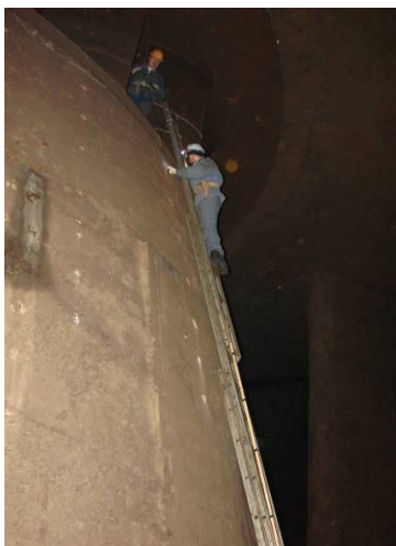
Рис. 9. Сквозное прозвучивание при контроле сплошности композитной системы: металлическая камера рабочего колеса турбины гидроагрегата – штрабной бетон заливки шахты камеры – монолитный бетон опорного конуса (вид со стороны опорного конуса)

Однако, несмотря на то, что сквозной метод является самым информативным применительно к бетону массивных сооружений, он используется сравнительно редко, что обусловлено значительными размерами конструктивных элементов и ограниченным доступом к ним. В этих условиях наиболее приемлемым, а часто и единственно возможным, является способ поверхностного прозвучивания, при котором излучатель и приемник устанавливаются на одной грани элемента.