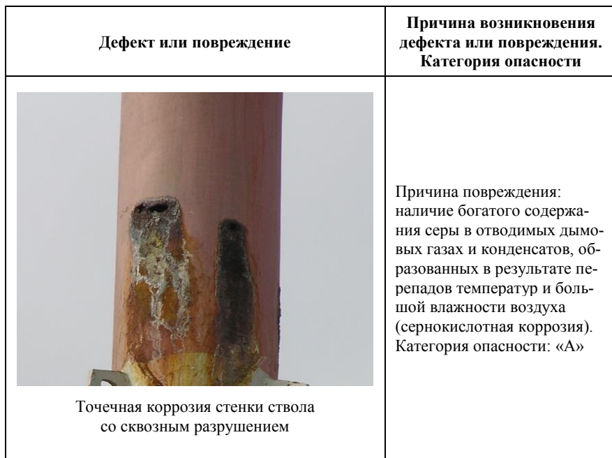
Таблица 1 Дефекты и повреждения металлических дымовых труб

Примеры характерных дефектов и повреждений металлических дымовых труб, выявляемые специалистами при проведении ЭПБ представлены в табл. 1.