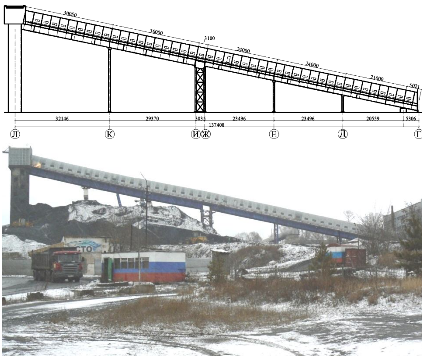
Рис. 1. Общий вид галереи

Фундаменты под опоры галереи – свайные, с монолитными железобетонными ростверками.