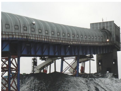
Рис. 3. Прогиб металлических балок Б1