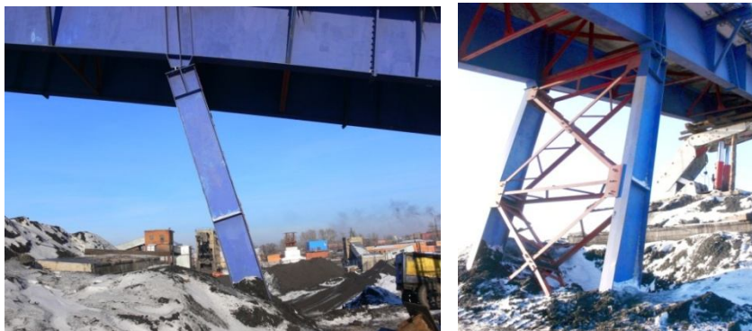
Рис. 2. Деформации металлической качающейся опоры по оси «К»

В процессе инструментального обследования строительных конструкций галереи производился мониторинг за деформациями неразрезных металлических балок Б-1 в осях «И-Л, 4/1-4/2». С помощью сертифицированных и поверенных приборов (электронный теодолит DJD5, электронный уровень S-Digit60 и лазерный дальномер «Leica Disto A5») была проведена геодезическая съемка металлических балок в осях «И-Л».