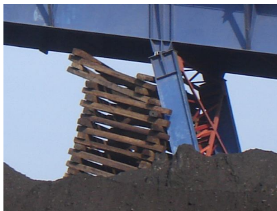
Рис. 4. Разрушенная ряжевая опора из деревянных брусьев

У металлических балок Б-1 в отдельных местах стенка, сваренная из стальных листов по длине и высоте балок, потеряла устойчивость в результате общих деформаций конструкций, повреждены также сварные швы между отдельными элементами стенки.